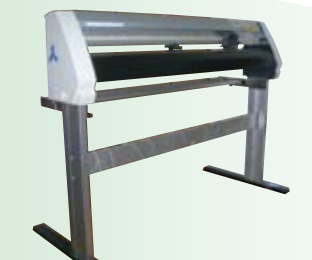
GRAPHTEC CUTTING PRO FC7000-100