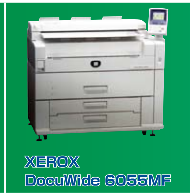
XEROX DocuWide 6055MF