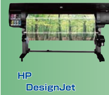
HP DesignJet Z6100

大型カラーインクジェットプリンター PS対応高速モデル 最大出力幅 1,270mm 印刷解像度 2,400×1,200dpi 印刷校正対応、高画質8色水性顔料インク