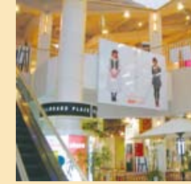
大型パネルサイン