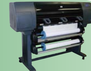
HP DesignJet 4500

大型カラーインクジェットプリンター PS対応高速モデル 最大出力幅 1,270mm 印刷解像度 2,400×1,200dpi 印刷校正対応、高画質8色水性顔料インク