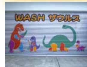
シャッターディスプレイ(手書きイラスト)