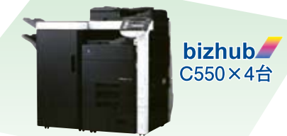
bizhub C550 × 4台