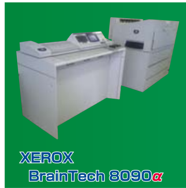
XEROX BrainTech 8090α