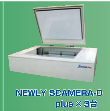
NEWLY SCAMERA-0 plus × 3台