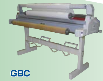
GBC ARCTIC EAGLE 1600

高速大型カラーインクジェットプリンター B0幅 最速カラー出力 4色染料インク A1判のカラー図面を1枚/分高速出力