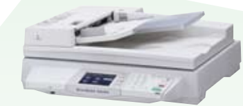
DocuScan C4260 × 5台